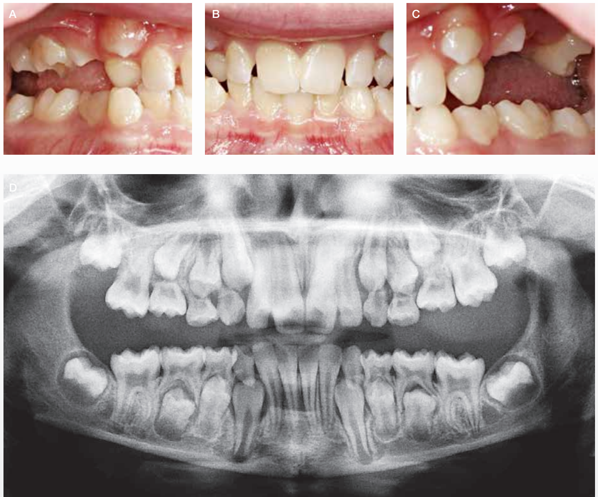
Fig. 3. Klinisk manifestation af DI hos kvinde på 36 år med OI type 4. A, B, C. Gråbrun eller gulligbrun farve på kronerne. Finerkrone på anden permanente molar i venstre side af underkæben (37) og mistet krone ses på første permanente molar i venstre side af underkæben (36). Derudover ses asymmetrisk okklusion med et lille underbid og åbent bid. D. Røntgenoptagelse i form af panoramaoptagelse viser, at alle 32 permanente tænder er til stede. Bemærk pulpaobliteration.

Fig. 3. Clinical manifestation of DI in female, 36 years old with OI type 4. A, B, C. Grey-brownish or yellow-brownish colour of the dental crowns. An artificial crown on the left second permanent molar of the lower jaw (37) and a missing crown on the left first permanent molar of the lower jaw 36. In addition, asymmetric occlusion with a minor mandibular overbite and open bite is seen. D. Panoramic X-ray which shows all 32 permanent teeth. Notice obliteration of the pulps.