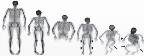
Fig. 1. OI manifesterer sig i skelettet betydeligt varierende fra næsten asymptotisk, mild OI til svær OI med deformede knogler. Røntgenbilleder af voksne med OI.

Fig. 1. OI appears skeletally with great variation from mild OI to severe OI with significant bone deformity. X-rays of adults with OI.