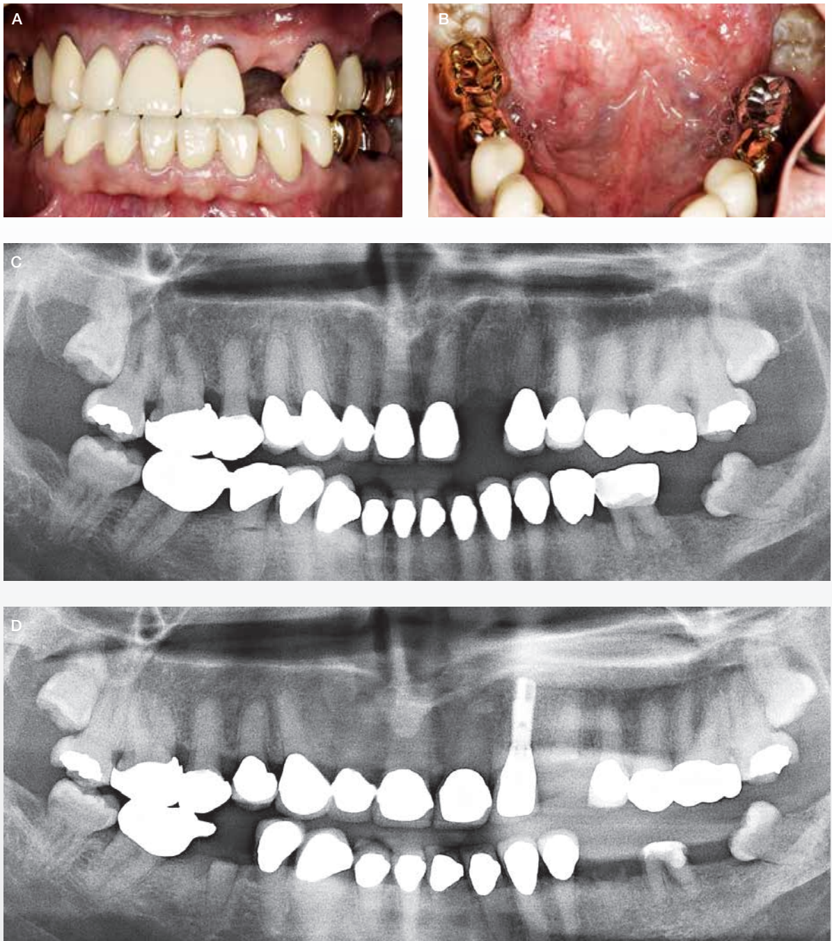
Fig. 5. A, B. Fuldkroner på alle tænder fraset fire molarer. 22 er ekstraheret efter tidligere kronebehandling og efterfølgende kronefraktur. C. Panoramarøntgen (45-årig), der viser generel pulpaobliteration, retention af 18 og 28, fravær af 22 og 37 og rodfraktur 44. D. Panoramarøntgen fem år senere. Implantat med krone på 22. Yderligere tre tænder med cervical rodfraktur og tab af den kliniske krone (23, 36, 35).

Fig. 5. A, B. Full-crowns on all teeth, except four molars. Tooth 22 has been extracted because of a crown-fracture. Previously, the tooth had an artificial crown. C. Panoramic X-ray at the age of 45 years showing obliteration of the pulps, retention of 18 and 28, missing 22 and 37, and a root-fracture on 44. D. Panoramic X-ray five years later. Implant with a crown replacing tooth 22. Additional three teeth have had cervical root fracture and loss of the clinical crown (23, 36, and 35).