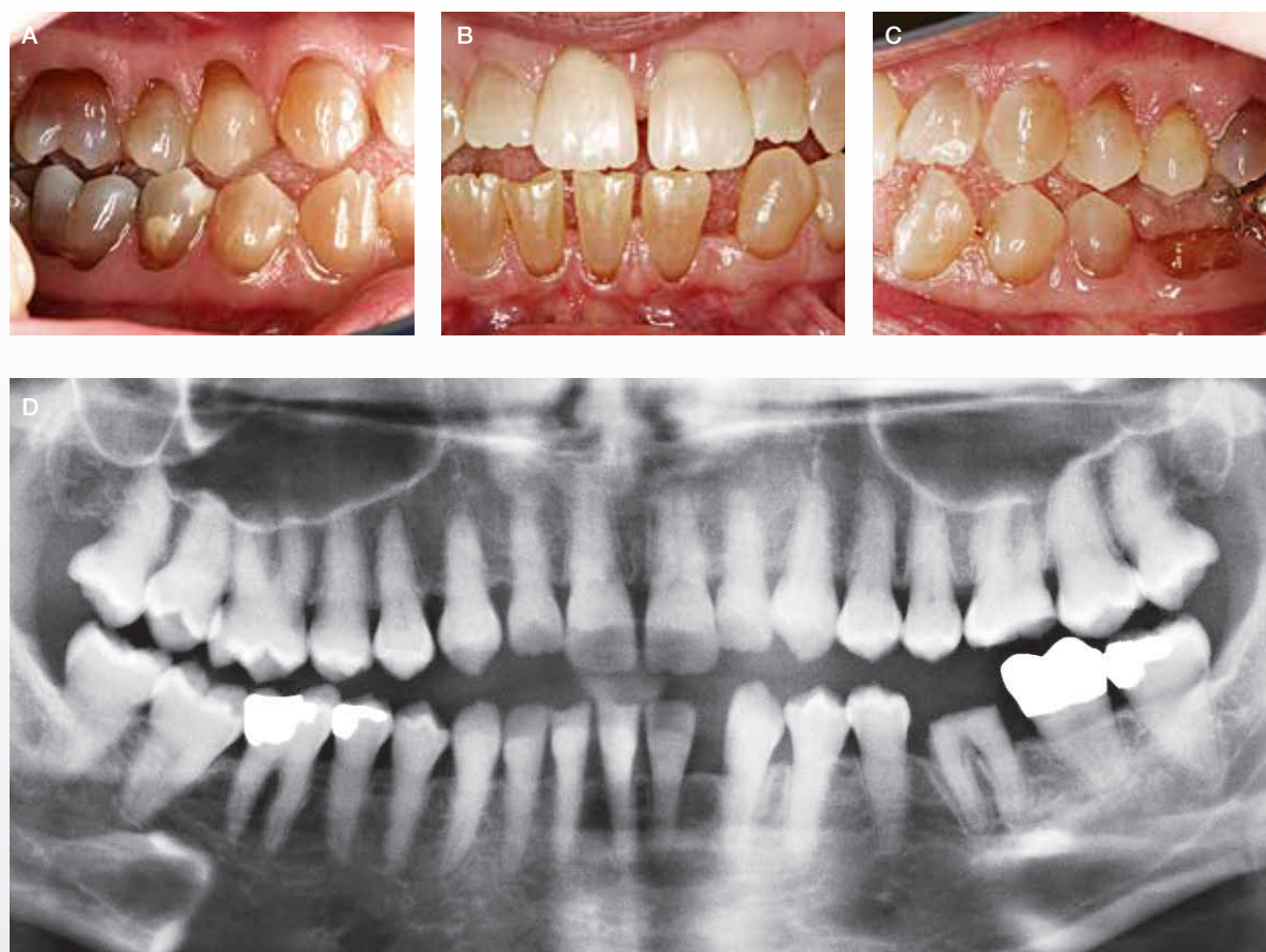
Fig. 4. Barn på 11 år med svær OI og uden umiddelbare tegn på DI. A, B, C. Atypisk eruption af tænder i overkæben. Bilateralt åbent bid. D. Panoramarøntgen viser normal aftegning af pulpa i både primære og permanente tænder.

Fig. 4. Child, 11 years of age, with a severe type of OI, but without clinical signs of DI. A, B, C. Atypical eruption of maxillary teeth. Bilateral open bite. D. Panoramic x-ray shows a normal pulp configuration in both deciduous and permanent teeth.