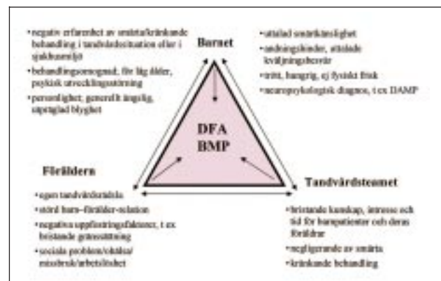
Fig. 2. Faktorerna barnet, föräldern och tandvårdsteamet påverkar barnets förmåga att samverka i tandvårdssituationen. Pilarna visar hur dessa faktorer, beroende på om de är positiva eller negativa, kan samverka med/motverka varandra och därmed ge effekt på tandvårdsräddsla (DFA) och behandlingssvårigheter (BMP). För vardera barnet, föräldern och tandvårdsteamet är negativt påverkande faktorer uppräknade.

Det skulle underlätta betydligt om man kunde prediktera barn med risk för att DFA/BMP föreligger. I en prospektiv undersökning av 3-åringar i Sverige fann man två intervjuvariabler som skilde barn med negativt beteende från dem med positivt (10). Dessa var dels om föräldrarna trodde att