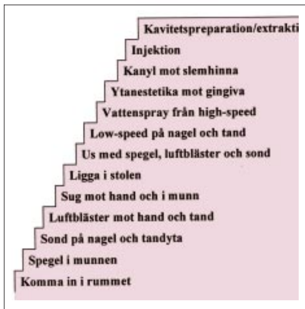
Fig. 3. Inskolningstrappa enligt Holst (13) som visar vilka behandlingssteg som bör ingå, och i vilken ordning dessa kan gås igenom, i samband med inskolning av barnpatient.

ceras genom behandlingssituationen förstår inte de olika behandlingsmomenten och uppfattar ofta hela situationen som skrämmande.