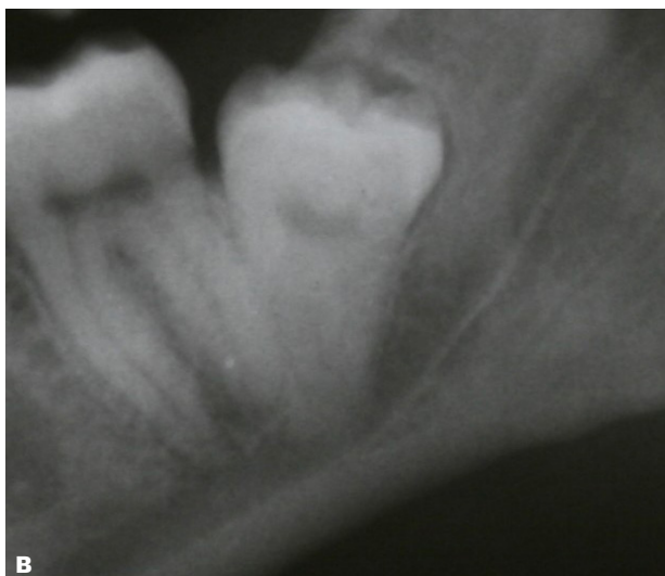
Fig. 2. Panoramaoptagelse. A. Horisontalt lejret tredjemolar i mandiblen.

B. Distoverteret vinkling af tredjemolar i mandiblen.