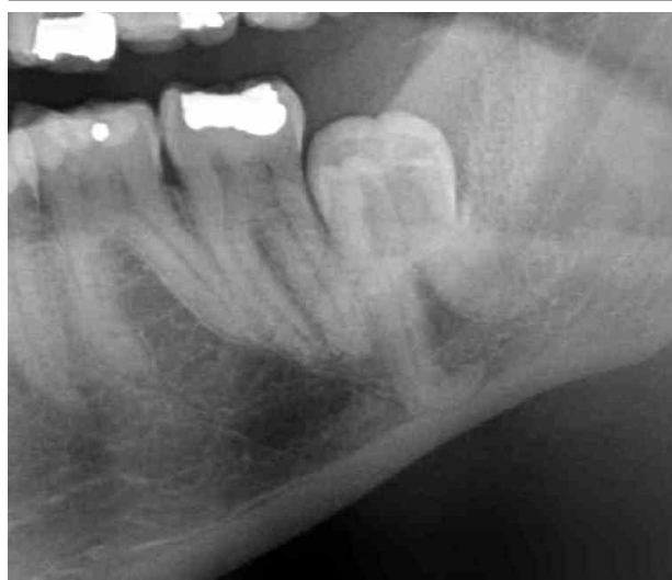
Fig. 3. Panoramaoptagelse viser en dybt lejret tredjemolar i mandiblen med spredte rødder.