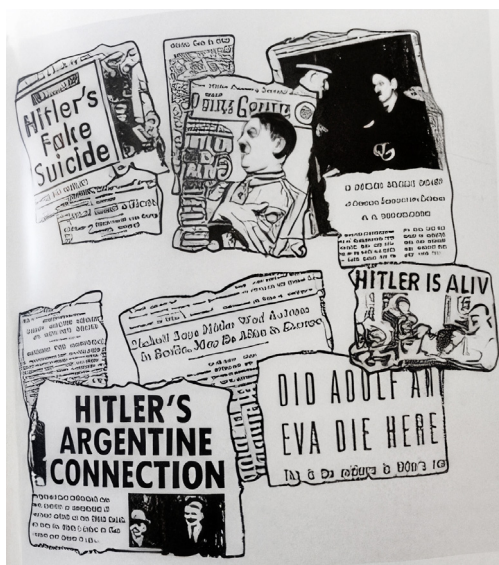
Fig. 8. Konspirationsteoriene florerede og gør det stadig. Fig. 8. Conspiracy theories abounded and still do.