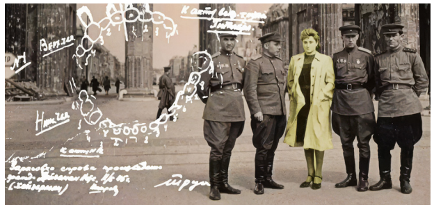
Fig. 3. SMERSH-gruppen ved ankomsten til Berlin. Tandsættet er klinikassistentens erindring.