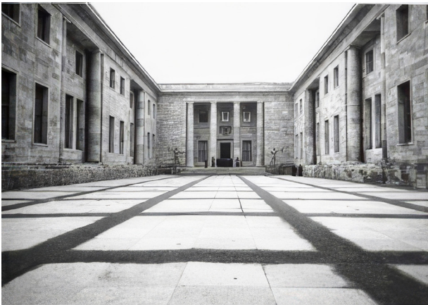
Fig. 1. Æresgården i det nybyggede Rigskancelli. Den underjordiske bunker var bygget i haven.