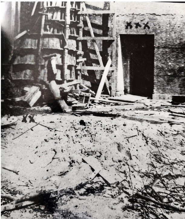
Fig. 4. Udpegning af stedet, hvor Hitlers lig blev brændt sammen med Eva Braun og hundene.