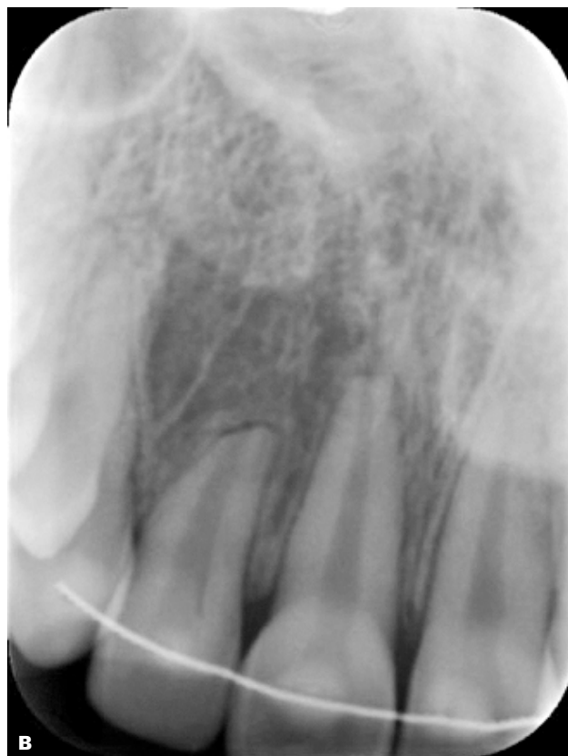
Fig. 1. Før A og efter B behandling (billeder udlånt fra Specialtandlægeuddannelsen i Ortodonti, Københavns Universitet).